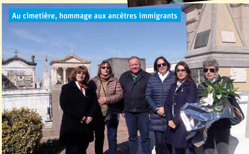
Au cimetière, hommage aux ancêtres immigrants