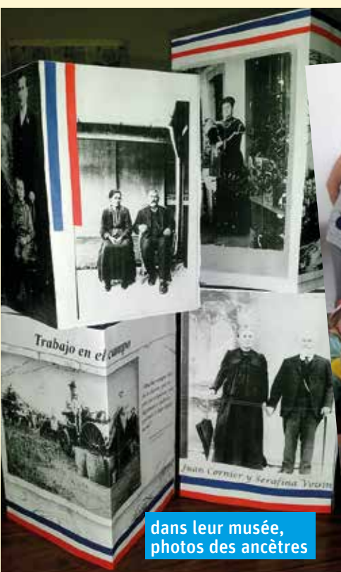
dans leur musée, photos des ancêtres

le Centre, lors de toutes les fêtes locales, vend des repas, des crêpes et autres. Les bénéfices sont investis dans l'aménagement de leurs locaux, comme dernièrement, la construction d'un mur en béton pour protéger leur bâtiment et l'achat de matériel pour le secrétariat. Chaque année, les membres du Comité ont participé à l'édition de la fête des collectivités, l'événement le plus important de l'année dans la colonie.