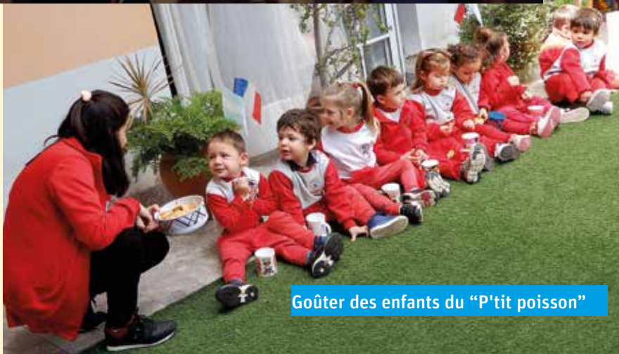
Goûter des enfants du "P'tit poisson"