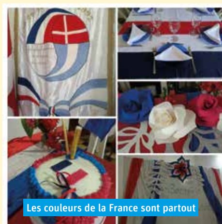
Les couleurs de la France sont partout