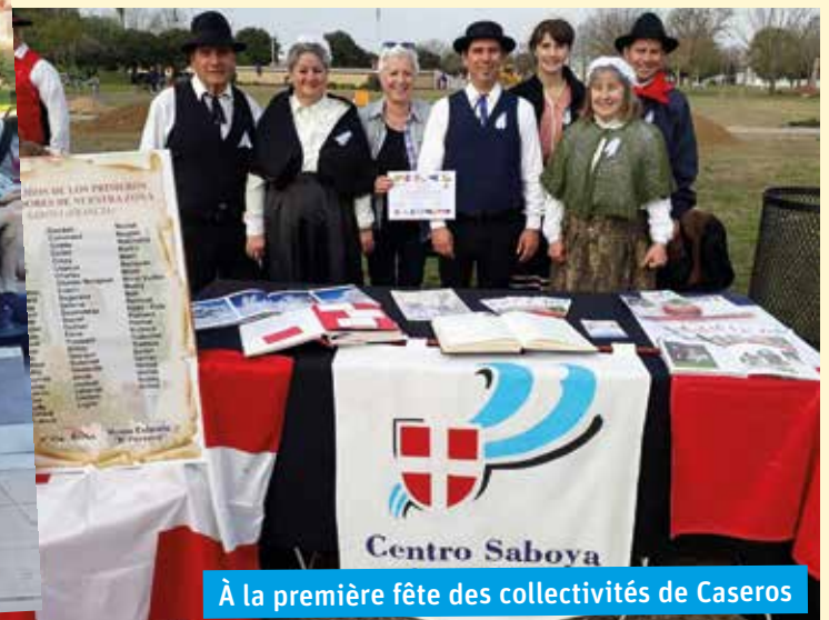
À la première fête des collectivités de Caseros