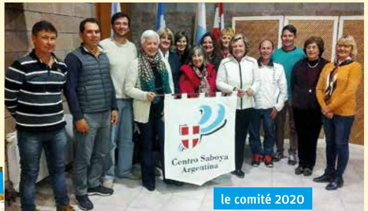
le comité 2020