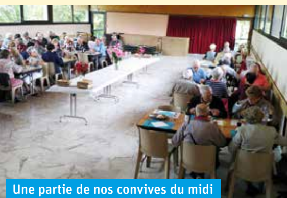
Une partie de nos convives du midi