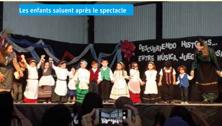
Les enfants saluent après le spectacle