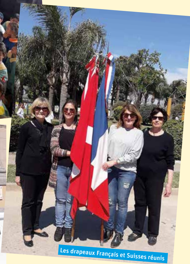
Les drapeaux Français et Suisses réunis