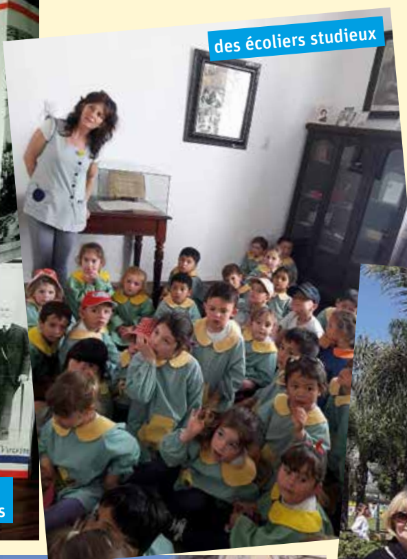
des écoliers studieux