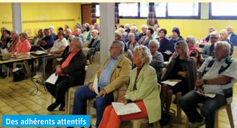
Des adhérents attentifs