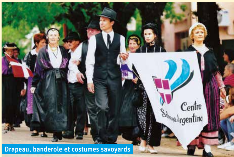
Drapeau, banderole et costumes savoyards