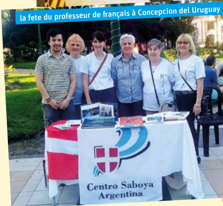
la fête du professeur de français à Conception del Uruguay