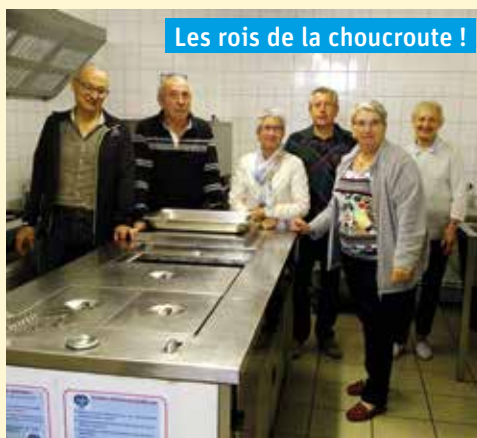
Les rois de la choucroute !